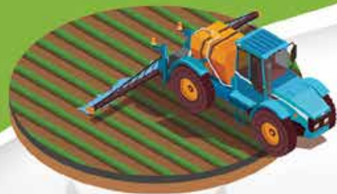
Interventions sur votre exploitation

EMERAUDE® est un système de traitement des effluents phytosanitaires basé sur le principe de l'ultrafiltration aux charbons actifs