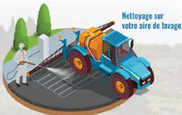
Nettoyage sur votre aire de lavage

EMERAUDE® est un système de traitement des effluents phytosanitaires basé sur le principe de l'ultrafiltration aux charbons actifs